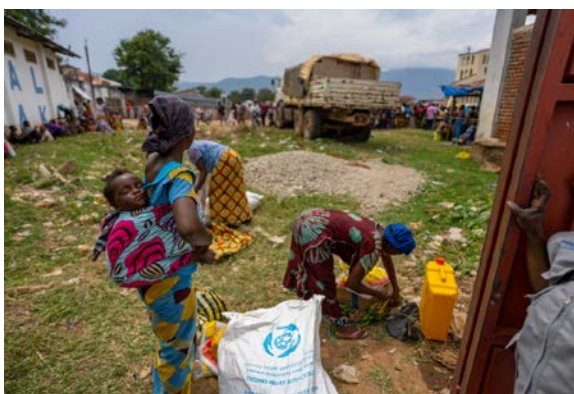
Le stade de Baraka, le 24 octobre, l'assistance humanitaire pour les déplacés a été fournie par UNICEF et le PAM, coordonnée par OCHA.