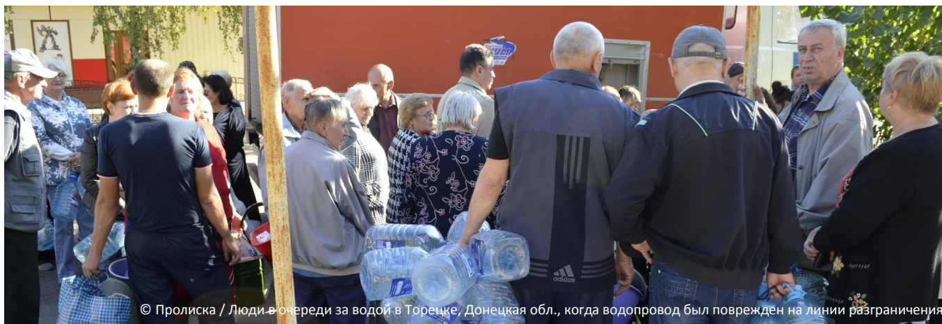
Люди в очереди за водой в Торечке, Донецкая обл., когда водопровод был поврежден на линии разграничения

КЛАСТЕР ПО ВОПРОСАМ ЗАЩИТЫ ВКЛЮЧАЕТ СУБКЛАСТЕРЫ ПО ВОПРОСАМ ЗАЩИТЫ ДЕТЕЙ, ГЕНДЕРНОГО НАСИЛИЯ И ПРОТИВОМИННОЙ ДЕЯТЕЛЬНОСТИ