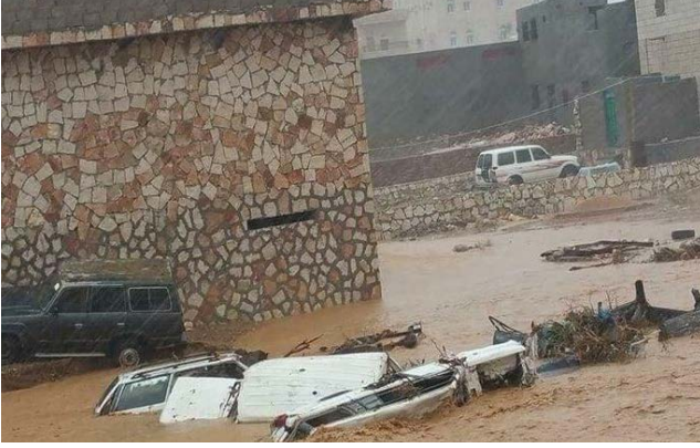
الفيضانات في سقطرى جراء إعصار ميكونو.

استجابة للاحتياجات الناشئة عن تأثير إعصار "ميكونو" يقوم شركاء العمل الإنساني بإرسال شحنة من الإمدادات الطارئة إلى حديبو بما في ذلك 10.5 مليون طن متري من الإمدادات الغذائية، والإمدادات الطبية الطارئة، و 1,000 طاقم من أطقم المأوى / المواد غير الغذائية و 4,000 طاقم نظافة، و 35 خزان مياه وإمدادات من الكلور لتنقية المياه. ومن المقرر أن يصل فريق من الأمم المتحدة إلى جزيرة سقطرى في 29 مايو للعمل مع السلطات المحلية على إجراء مزيد من التقييم للاحتياجات وتنسيق جهود الاستجابة. ويمكن الاطلاع على المستجدات حول اعصار ميكونو الصادر من مكتب الأمم المتحدة لتنسيق الشؤون الإنسانية (أوتشا) عبر الرابط التالي: https://reliefweb.int/report/yemen/ye-mencyclone-mekunu-flash-update-2-27-may-2018