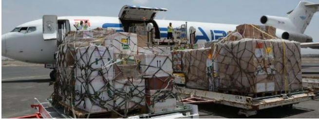
شحنات تابعة لمنظمة الصحة العالمية.

صنعاء: قُتل أربعة مدنيين وأصيب تسعة آخرون بجروح في غارات جوية ضربت محطة الوقود التابعة لشركة النفط اليمنية في مدينة صنعاء في 26 مايو. وكان من بين الضحايا عدد من النساء والأطفال. وفي محافظة مارب، أكد مكتب الصحة أن خمسة مدنيين قتلوا وأصيب 22 آخرون بجروح في انفجار وقع في سوق محلي في منطقة المجمع المكتظة بالسكان في مدينة مارب في 22 مايو. وفي هذه الأثناء وصلت طائرتان لمنظمة الصحة العالمية تحملاً أكثر من 21 طناً من الأدوية الأساسية إلى مطار صنعاء خلال الفترة المشمولة بالتقرير. وتشمل الإمدادات أطقماً لعلاج الصدمات لعلاج 3,200 مريض يحتاجون إلى رعاية جراحية وأدوية لعلاج بعض الأمراض غير المعدية والكوليرا. وقامت طائرة تابعة لمنظمة اليونيسف بتسليم لقاحات منقذة للحياة لأكثر من ستة ملايين طفل.