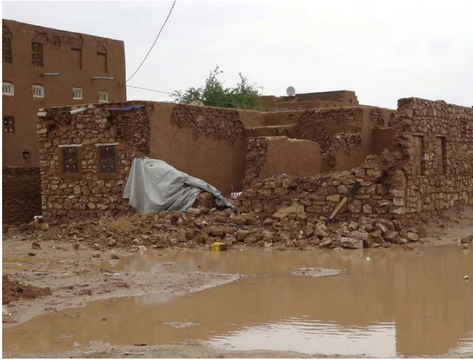
إعصار ساغار تسبب في حدوث أضرار محدودة في البنية التحتية للمناطق الساحلية الجنوبية

تم الإبلاغ عن هطول أمطار غزيرة وفيضانات على طول المناطق الساحلية لخليج عدن خلال الفترة المشمولة بالتقرير ، حيث تحرك الإعصار ساغار نحو الصومال وجيبوتي. ووفقاً للهيئة العامة للطيران المدني والأرصاد الجوية في اليمن، فإن معظم المناطق على طول خط الساحل الجنوبي لم تتأثر إلى حد كبير باستثناء بعض الفيضانات المحلية التي أضرت بالبنية التحتية.