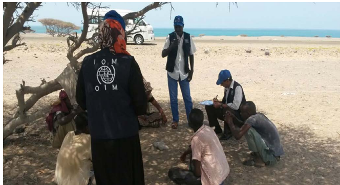
مهاجرون تمت مقابلتهم حال وصولهم من قبل المنظمة الدولية للهجرة

إن الصراع والأزمة الإنسانية الحادة جدا لم تمنع وصول المهاجرين من القرن الأفريقي. ويصل المهاجرون إلى اليمن على أمل الاستمرار في البحث عن فرص اقتصادية أفضل في دول الخليج الغنية، لا سيما المملكة العربية السعودية. ويتوجه