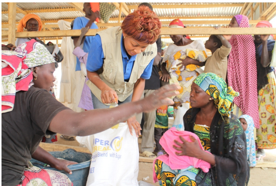
Distribution d'aliments nutritionnels fournis par le PAM aux femmes enceintes et allaitantes au camp de Minawao.