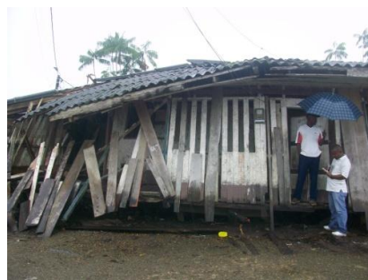
Daños en viviendas (Guapi – Cauca)