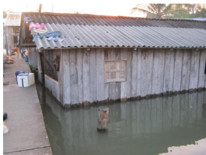
Marea alta en Las Varas (Santa Bárbara – Nariño)