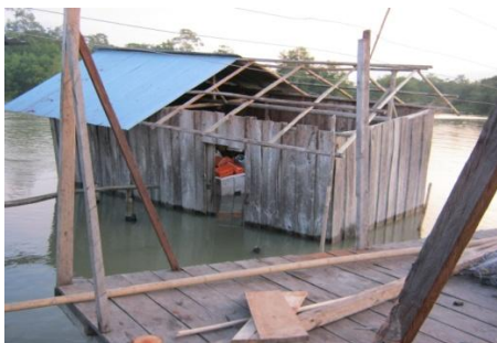
Daños en viviendas Las Varas (Santa Bárbara – Nariño) / Foto: Líderes comunidad Las Varas.

El Sistema Nacional de Gestión del Riesgo de Desastres (SNGRD) activó su Plan de Acción para iniciar la verificación de la afectación. A la fecha se están realizando evaluaciones en áreas remotas y con acceso físico limitado. Fuentes comunitarias y locales alertan sobre necesidades en los sectores de albergue, ayuda no alimentaria, seguridad alimentaria y nutrición, pero no se cuenta aún con informes detallados ni desagregados sobre necesidades y vacíos en respuesta.