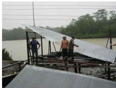
Daños en viviendas Las Varas (Santa Bárbara – Nariño)