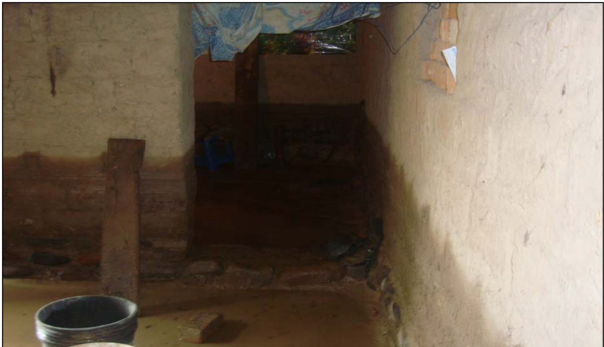
FOTO DE UNA VIVIENDA INUNDADA