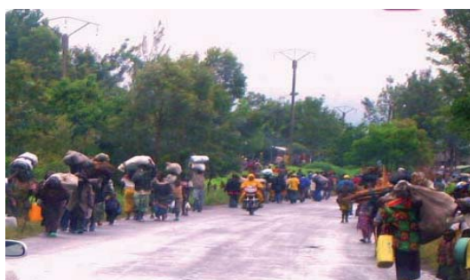
Populations fuyant les combats à Saké, Goma/RDC