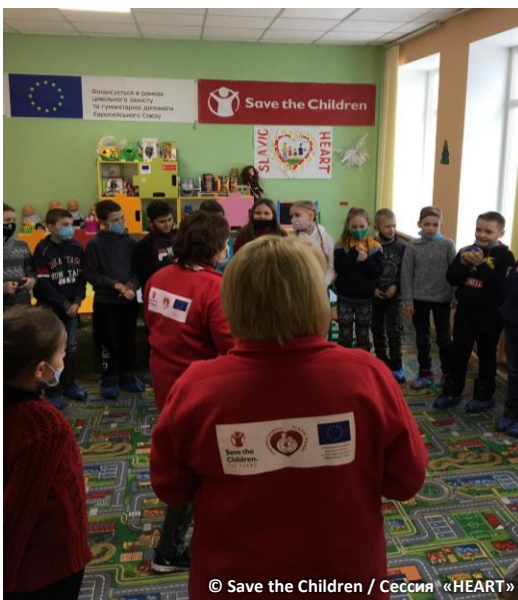
Сессия «HEART»