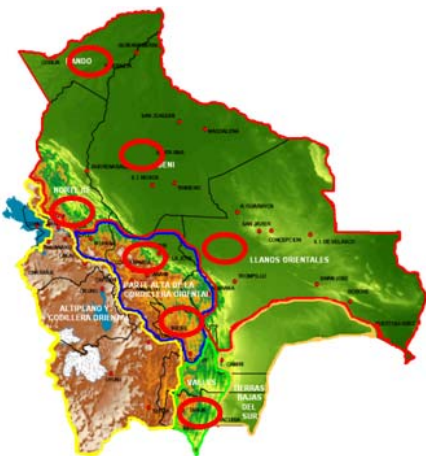
Mapa N°1: Ubicación de Departamentos afectados

En la reunión del Consejo Nacional para la reducción de riesgos y atención de desastres y/o emergencias (CONARADE) realizada el día 14 de enero de 2010, se informó sobre la situación de emergencias /desastres (inundaciones, riadas, deslizamientos), indican que 8 departamentos tienen problemas, pero los mas afectados son Cochabamba, Santa Cruz, La Paz. Hasta la fecha se tiene un total de 8.200 familias afectadas (ver cuadro N°1).