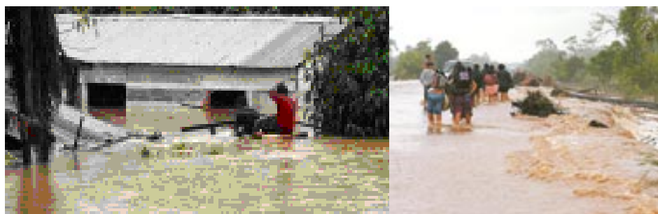
Fotos: Inundación de viviendas y carretera en Yapacani (Fotos de la prensa, 15/01/10)