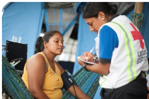
La Coalición complementa las iniciativas existentes en materia de resiliencia, al ofrecer un mecanismo para el desarrollo de actividades de resiliencia lideradas por las comunidades.

el objetivo es involucrar a, al menos, una persona en cada hogar alrededor del mundo – en países de altos, medianos y bajos ingresos – para que tomen acciones para la resiliencia individual y comunitaria. Esto se realizará mediante acceso a capital financiero, educación y capacitación, protección de bienes naturales, acceso a servicios e infraestructura, mayor capital social, tal como redes de voluntarios o la aplicación de Derecho Internacional en Respuesta a Desastres y los derechos humanos en desastres.