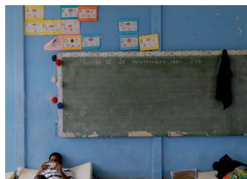
COSTA RICA: La comunidad de Batán en la provincia de Limón fue una de las comunidades evacuadas por la emergencia. En las áreas afectadas clases fueron suspendidas.

Para más información visitar: www.redhum.org/emergencia