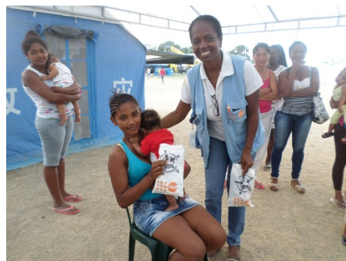
ECUADOR: La población en el cantón de Atacames lucha por reconstruir sus vidas después del terremoto de abril. Las constantes réplicas y el fuerte sismo de diciembre complican más las tareas de recuperación tanto física como emocional.

Para más información visitar: www.redhum.org/emergencia