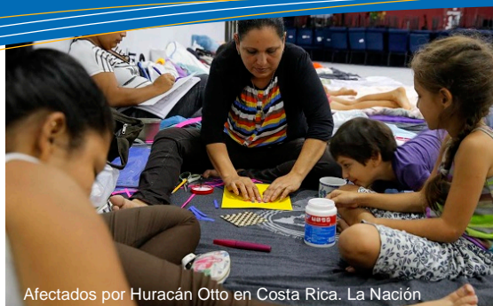
Afectados por Huracán Otto en Costa Rica.

Nota: Las cifras son tomadas de informes oficiales, sin embargo, no implica aprobación de la ONU o los estados miembros - como números finales. Las cifras son referencia. Si requiere de mayores detalles debe contactar a las autoridades nacionales.