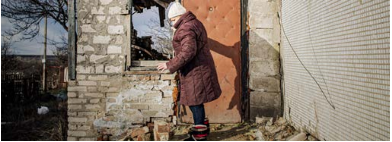
ЛИПЦІ, ХАРКІВСЬКА ОБЛАСТЬ, УКРАЇНА

Жінка на ганку свого будинку, пошкодженого унаслідок бойових дій на Харківщині. НУО "Проліска" за підтримки Гуманітарного фонду для України забезпечила її необхідними взимку речами. Фото: "Проліска", листопад 2022 р.