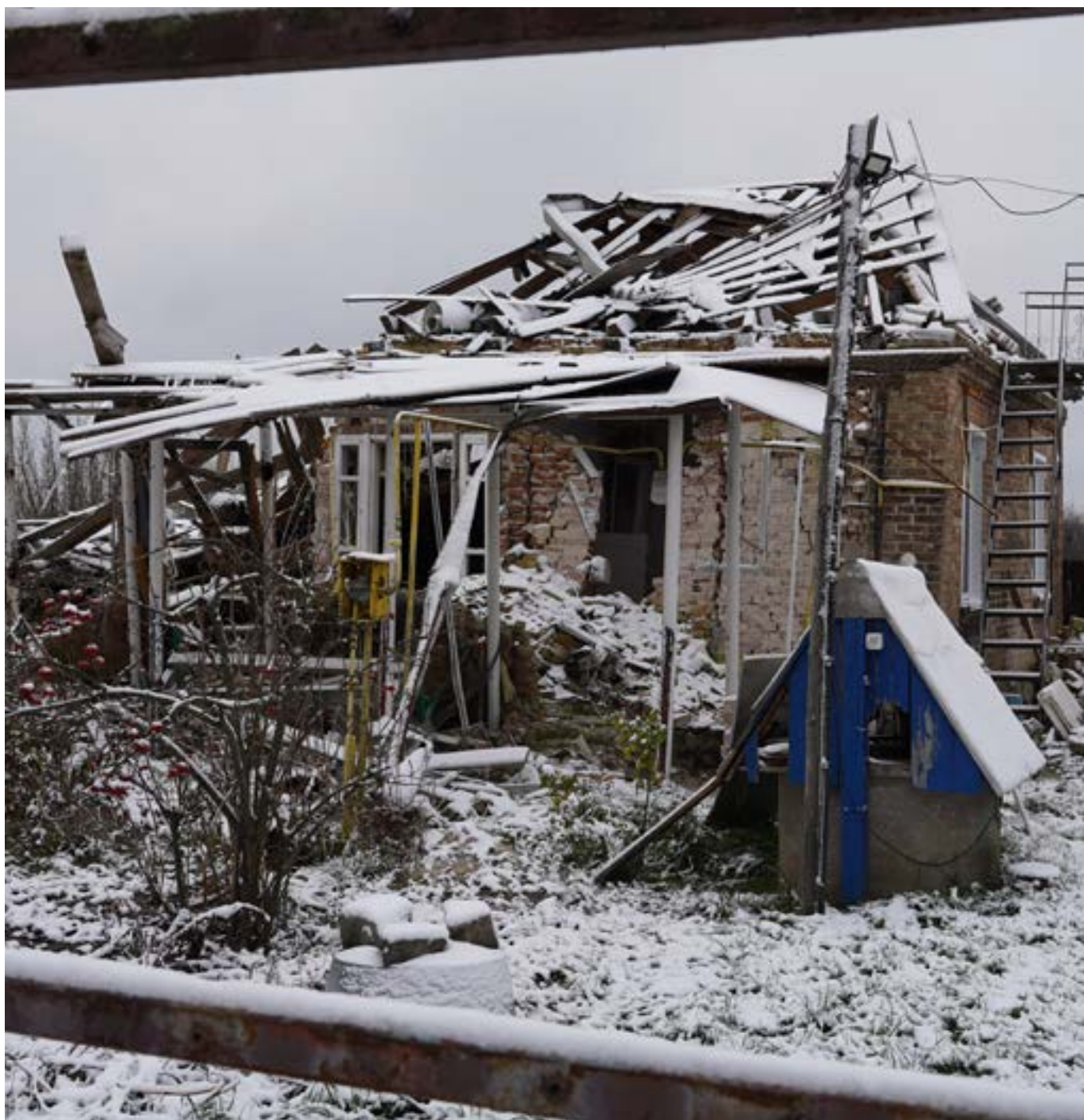
Фото: УВКБ ООН/Вікторія Андрієвська, 18 листопада 2022 року.

Цей будинок по дорозі в село Забуяння лише один зі зруйнованих унаслідок сильних боїв у Київській області в лютому та березні 2022 року.