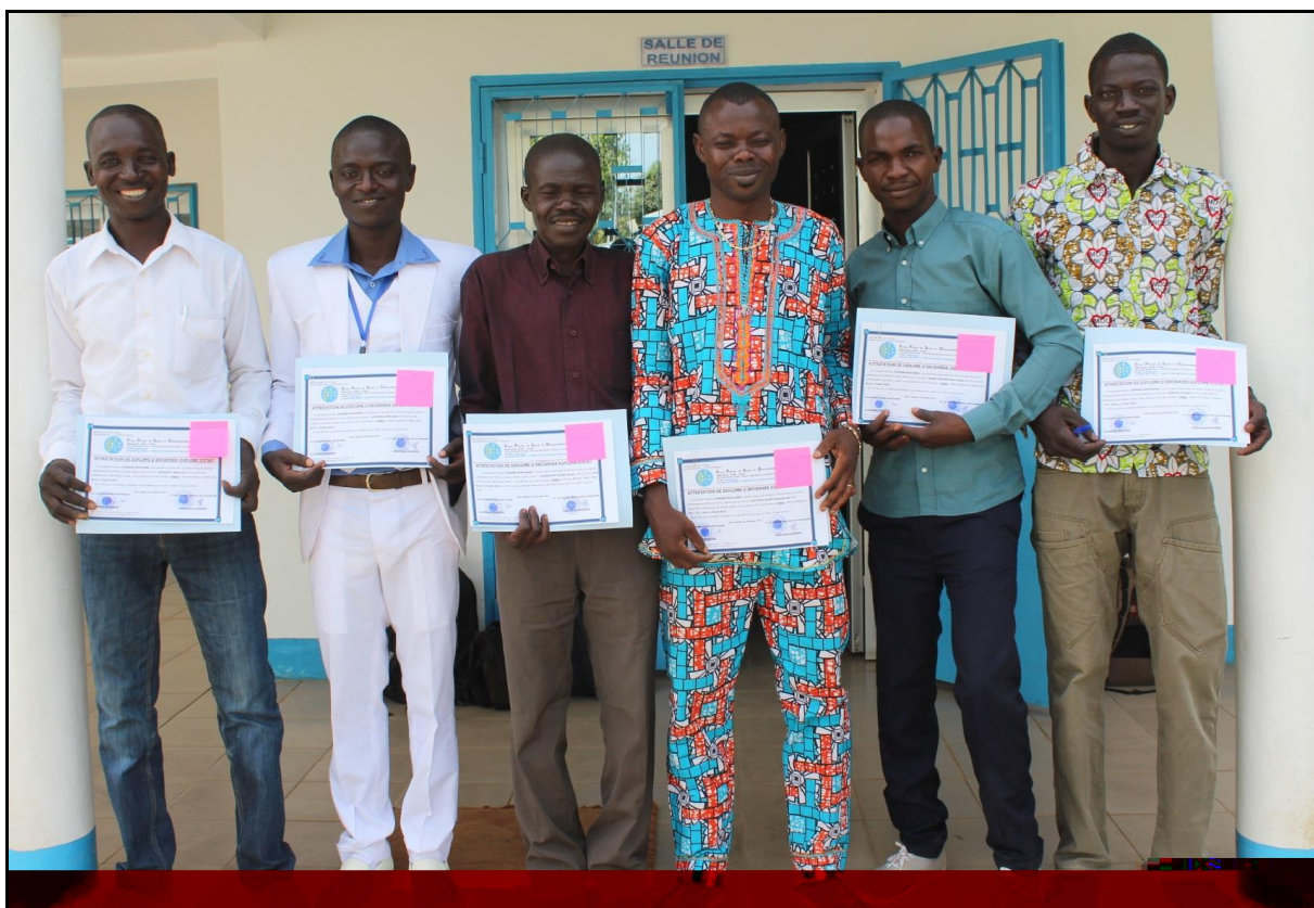
La joie des lauréats tenant leurs diplômes.