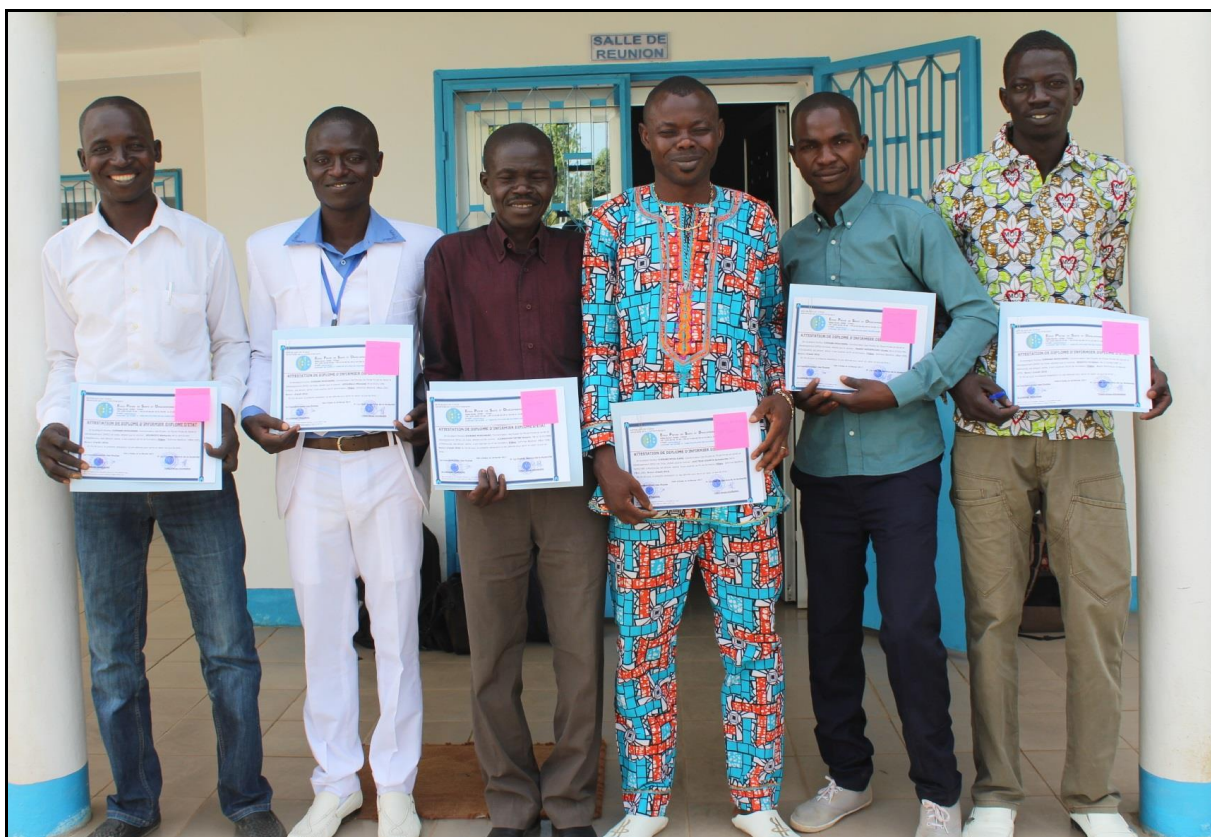
La joie des lauréats tenant leurs diplômes.