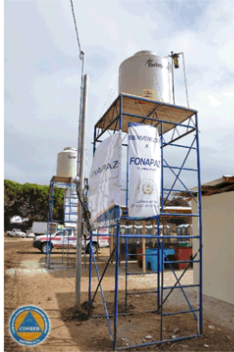
Depósitos de agua para las familias en los ATU's

El Sistema CONRED tomo en cuenta las Normas Mínimas para la Respuesta Humanitaria de las familias afectadas de las colonias La Asunción, Los Magueyes, Los Olivos, Finca San Jerónimo y Anexo San José Buena Vista, de la zona 1 de Mixco, garantizando el cumplimiento de la Carta Humanitaria a la cual es signataria Guatemala.