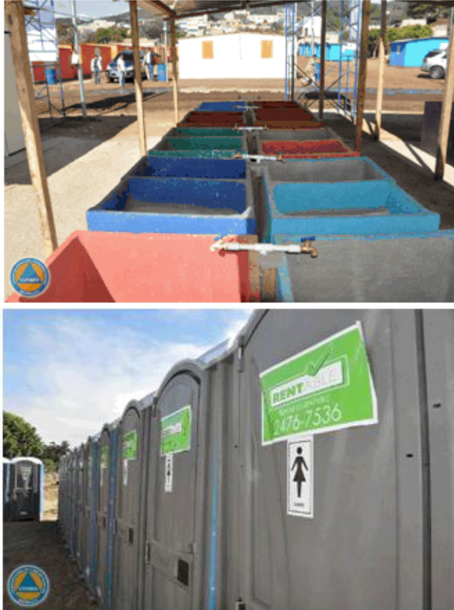
Pilas y servicios sanitarios con los que cuentan las personas en Lo de Coy

Las Normas Mínimas para la Respuesta Humanitaria de Esfera señala que es necesario los servicios e instalaciones esenciales como disponer de acceso seguro, protegido y equitativo de servicios esenciales, entre ellos instalaciones de agua y saneamiento, eliminación de desechos sólidos, zonas recreativas y de juego, así como alumbrado.