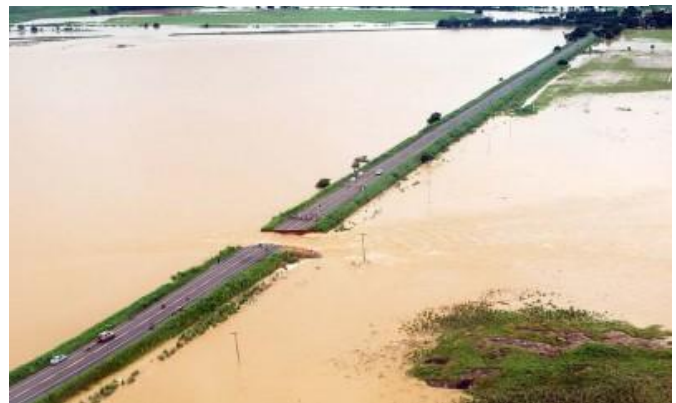
The road that dams the Murise River (Minas Gerais) collapsed during the floods.