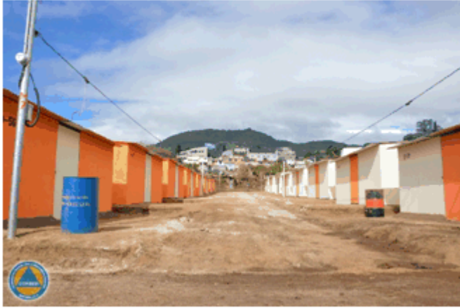
ATU's dividos por calles de 4 metros de ancho

Además debe ofrecer la posibilidad de instalar subdivisiones dentro de viviendas individuales y el ATU se entrega con la división colocada, creando dos ambiente. La Norma indica que debe proveer confort térmico de acuerdo a las condiciones climáticas específicas para cada estación, una ventilación y una protección óptima; el ATU es fresco en clima cálido y caliente en clima frío debido a los materiales tanto en techo como en muros, a su vez es resistente al fuego, humedad y roedores.